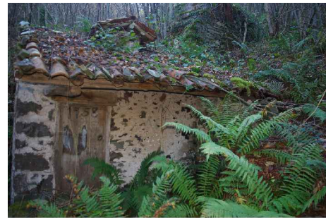
E.A.:ALZADOS MOLINO 11