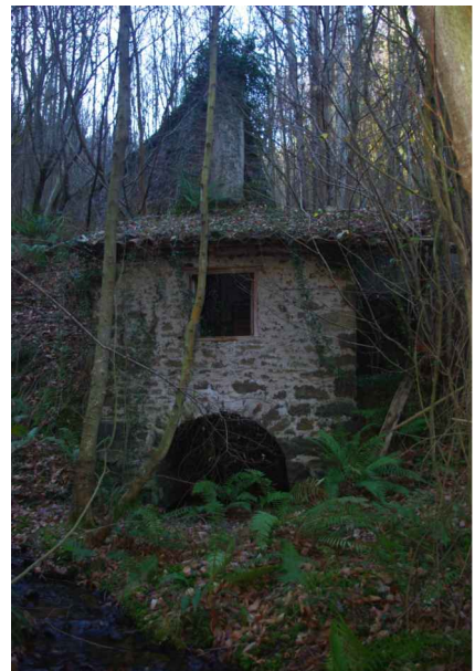
E.A.:ALZADOS MOLINO 10