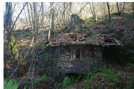
E.A.:ALZADOS MOLINO 9