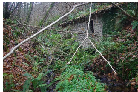
E.A.:ALZADOS MOLINO 7