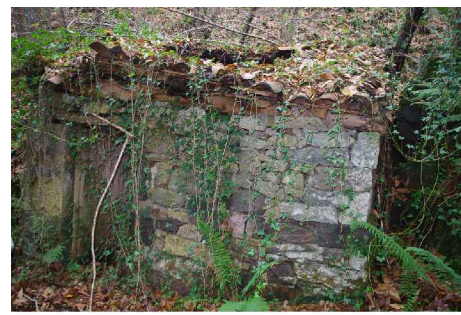
E.A.:ALZADOS MOLINO 6