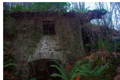
E.A.:ALZADOS MOLINO 5