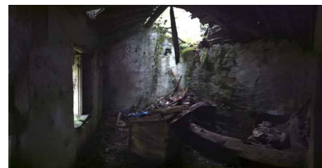
E.A.:ALZADOS MOLINO 4