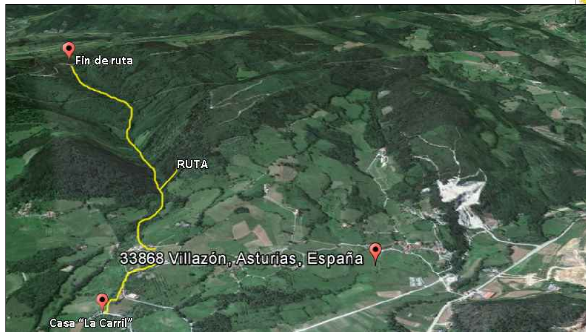
SITUACIÓN EN VILLAZÓN