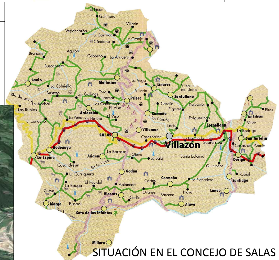
SITUACIÓN EN EL CONCEJO DE SALAS